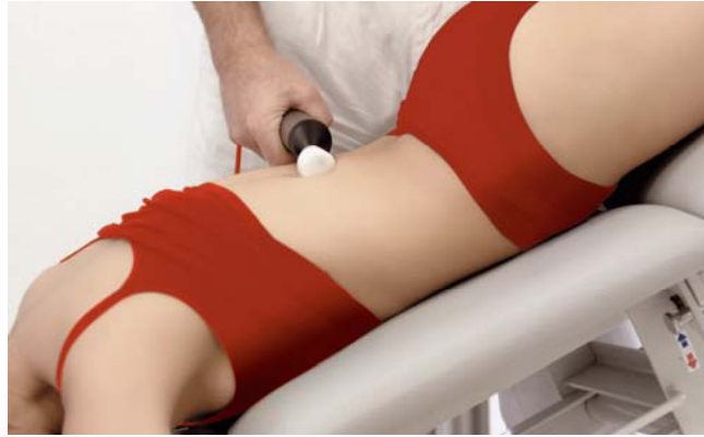
Sırt Bölgesi İçin Uygulama Diz Bölgesi İçin Uygulama