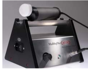
Matriks-Ritm-Tedavisi yaparken kullanılan tedavi aleti.

Bu tedavi aletinin özel bir şekilde biçimlendirilmiş tedavi başlığı, vücudumuzun kendine özgü fizyolojik titreşimlerinin